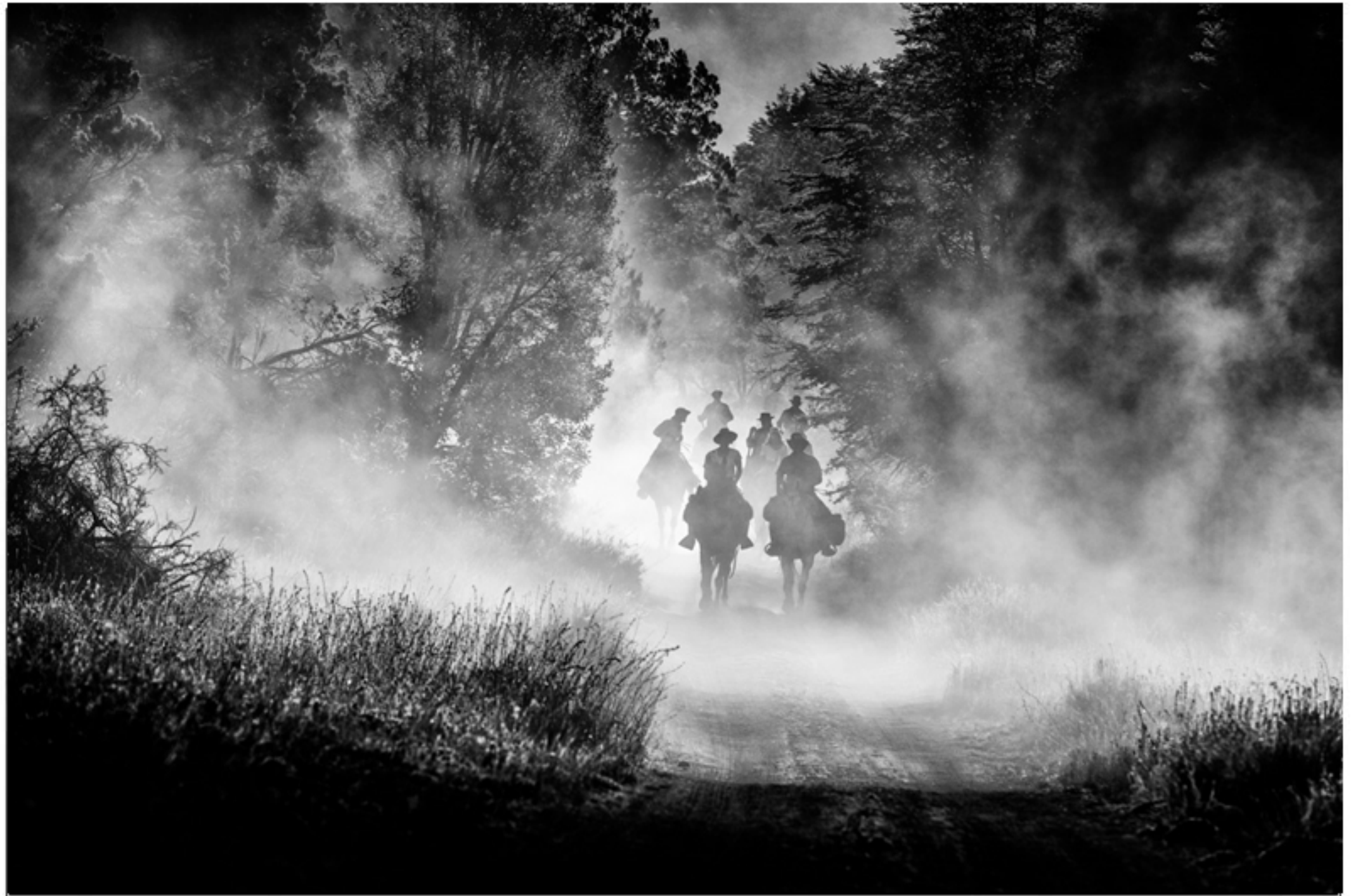
"SALIENDO DEL BOSQUE" TECNICA: Digital sin intervención IMPRESION: Glicée-Papel de algodón