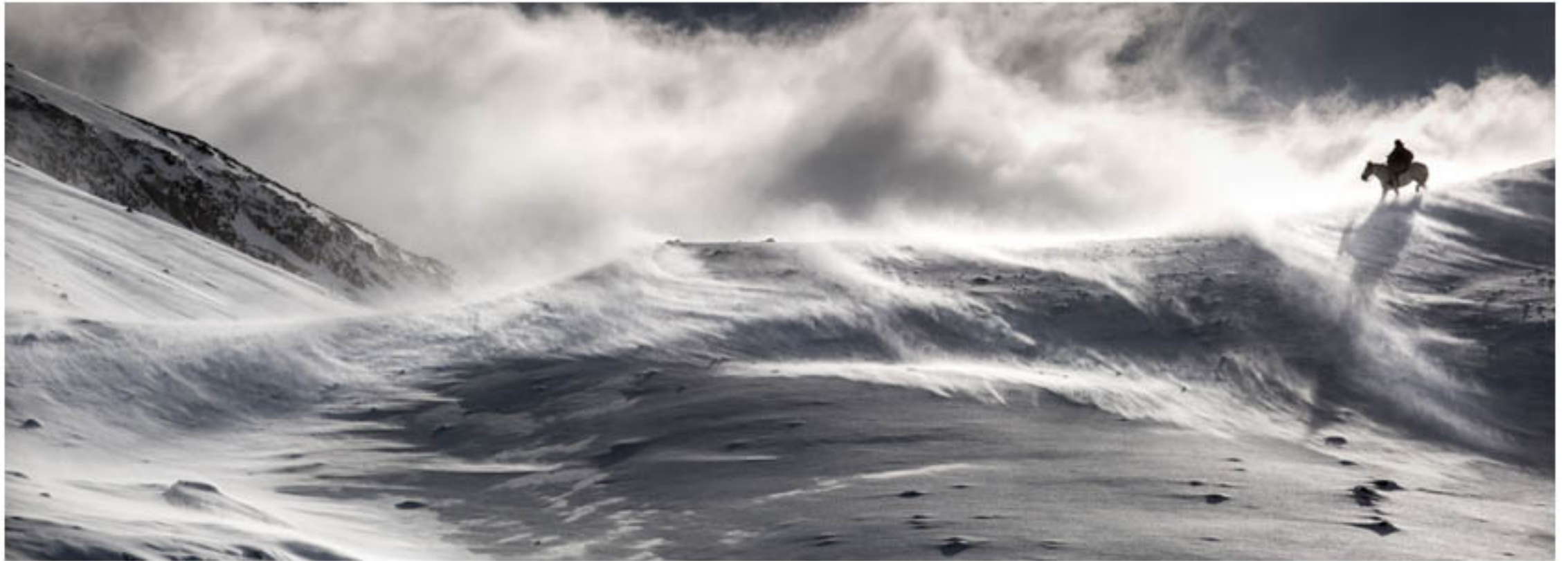
"MAR DE NIEVE" TECNICA: Digital sin intervencion IMPRESIÓN: Gicée-papel de algodón