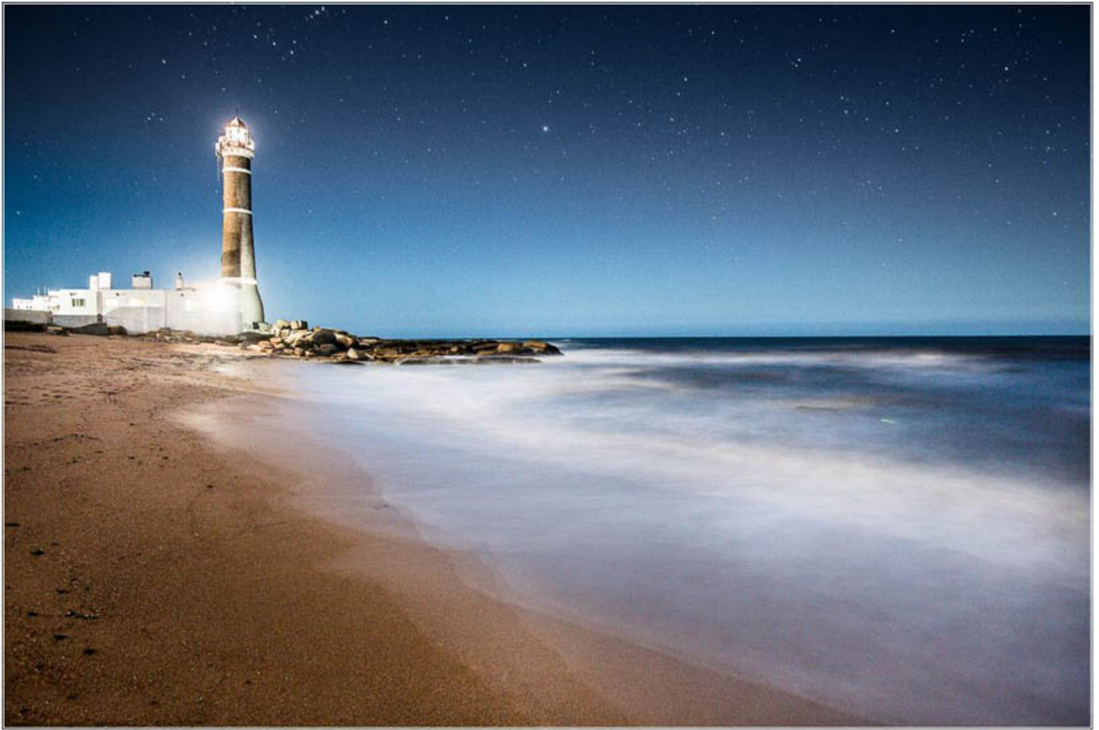
"EL FARO" TECNICA: Digital sin intervención IMPRESION: Glicée-Papel de algodón