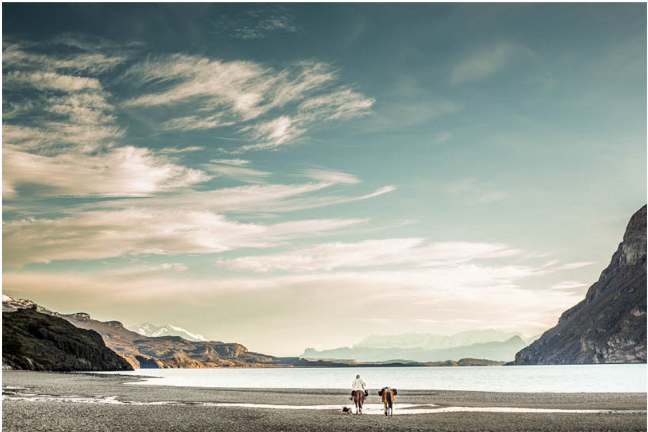
"TIERRA SOLITARIA" TECNICA: Digital sin intervención IMPRESION: Glicée-Papel de algodón