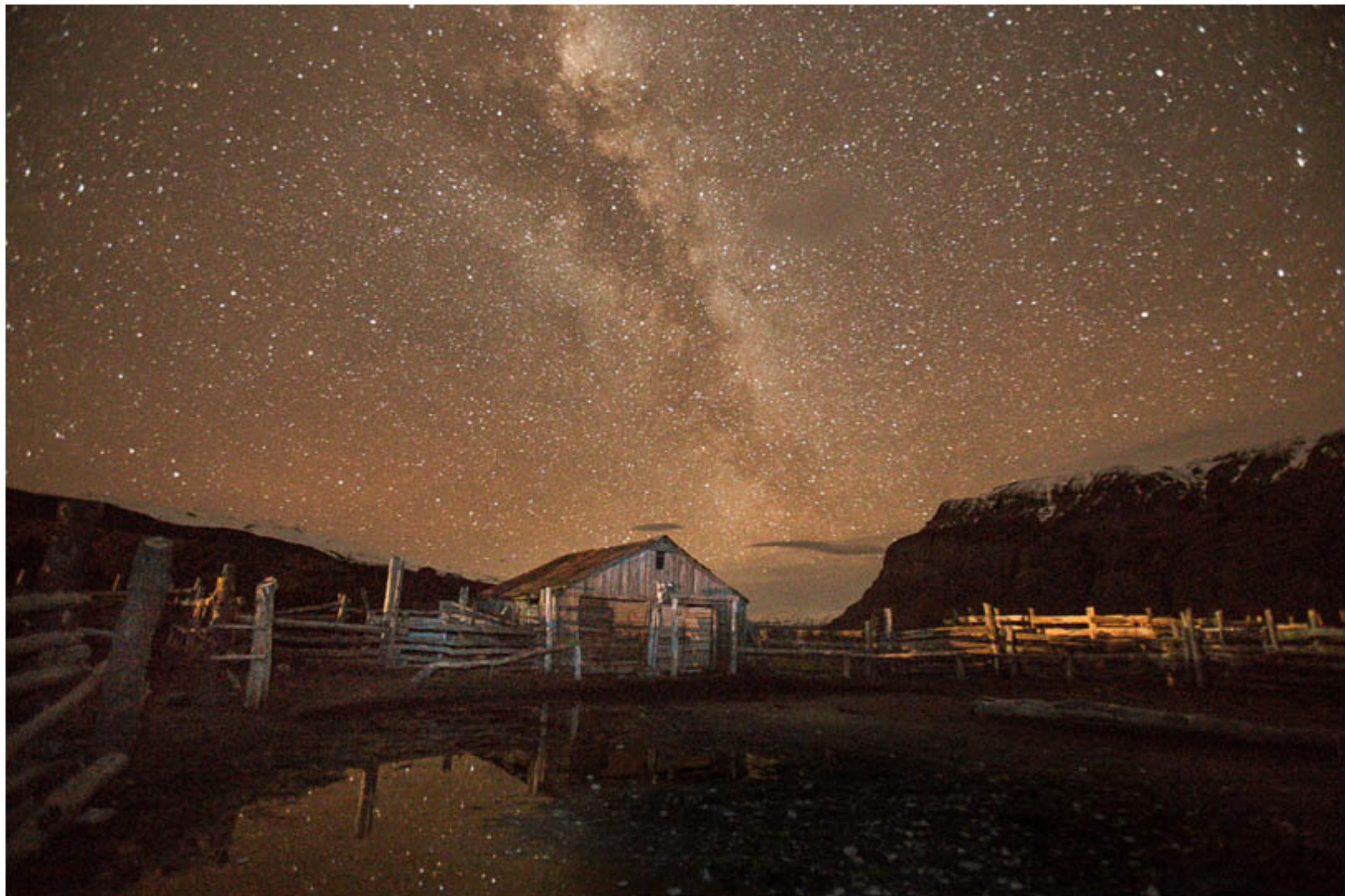
"INFINITAS CERTEZAS" TECNICA: Digital sin intervención IMPRESION: Glicée-Papel de algodón