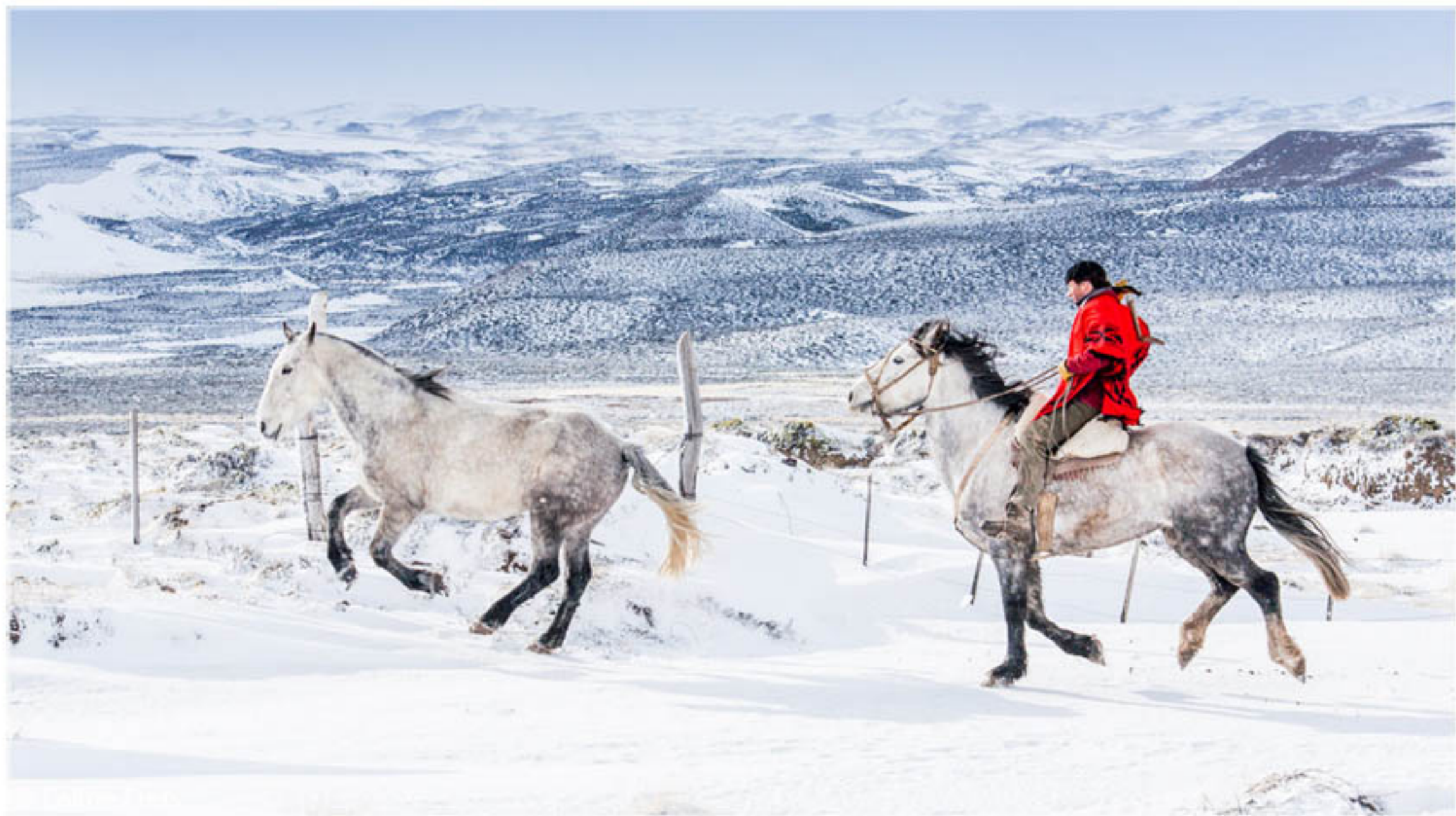
"FRÍO Y LIBRE" TECNICA: Digital sin intervención IMPRESION: Glicée-Papel de algodón