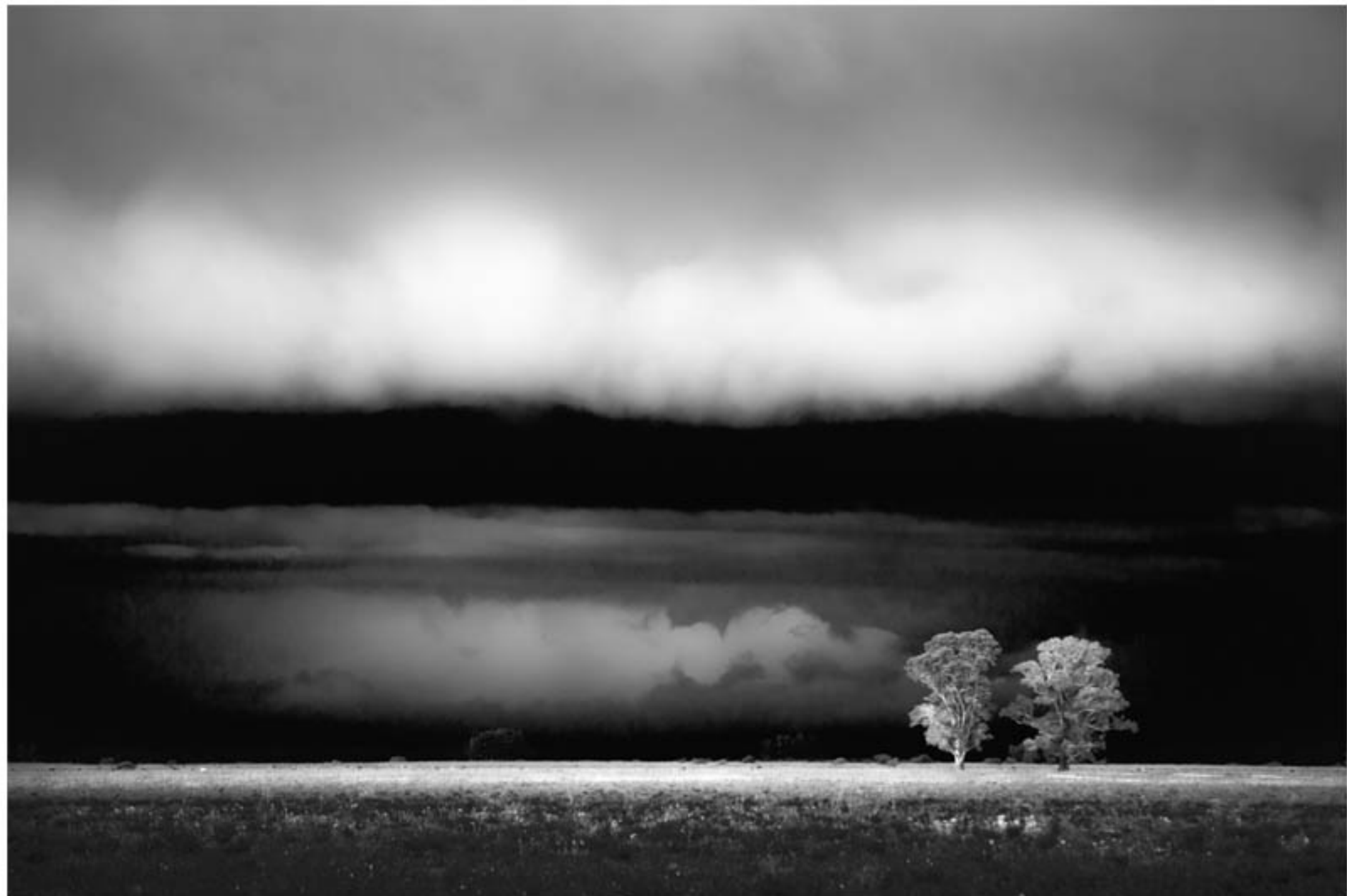
"MONTE EN TORMENTA" TECNICA: Digital sin intervención IMPRESION: Glicée-Papel de algodón