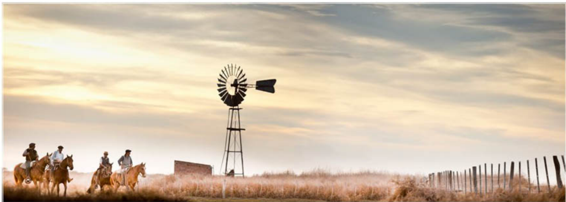
"VUELTA A LAS CASAS II" TECNICA: Digital sin intervencion IMPRESIÓN: Gicée-papel de algodón