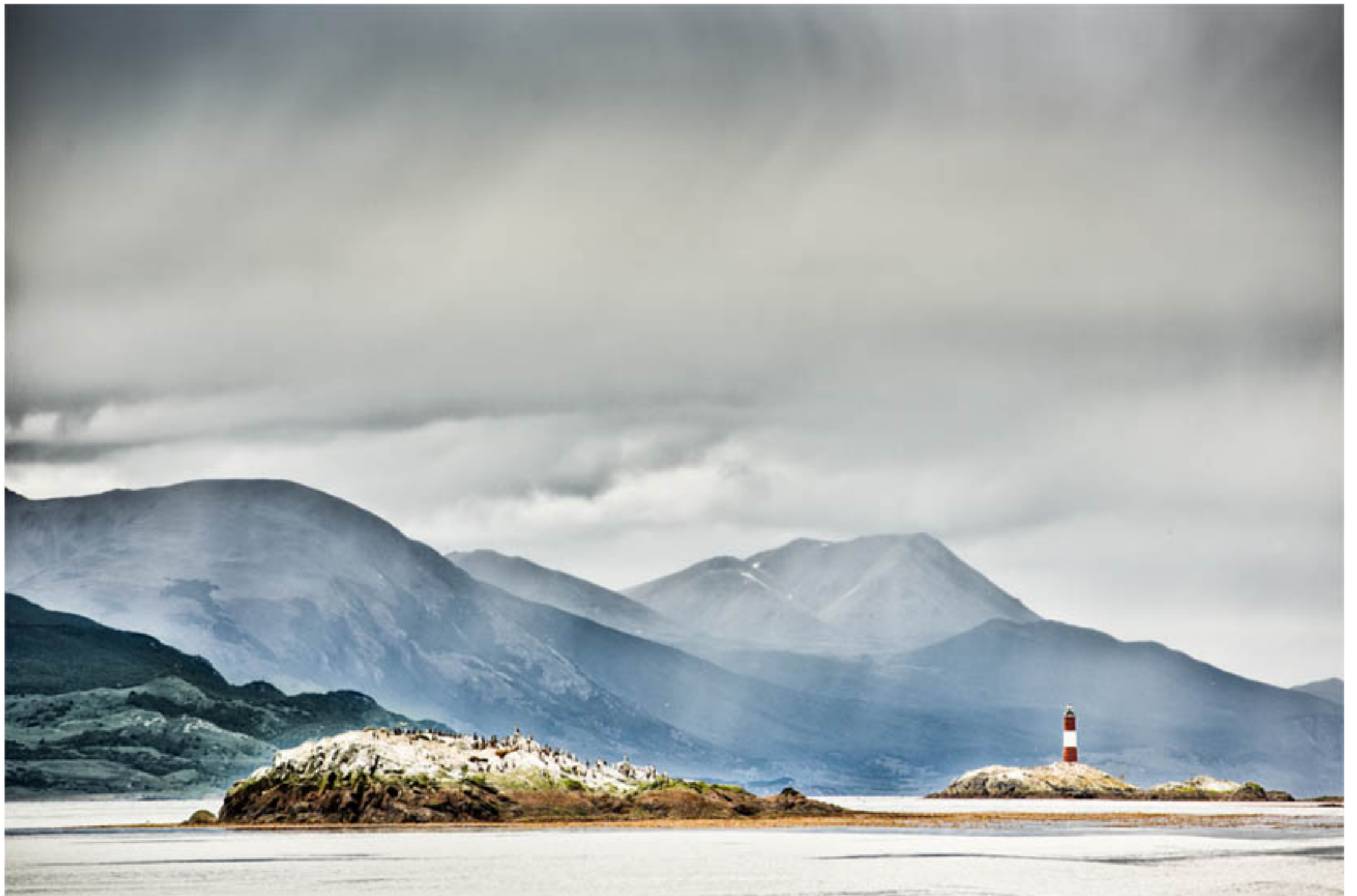
"DONDE TERMINA EL SUR" TECNICA: Digital sin intervención IMPRESION: Glicée-Papel de algodón