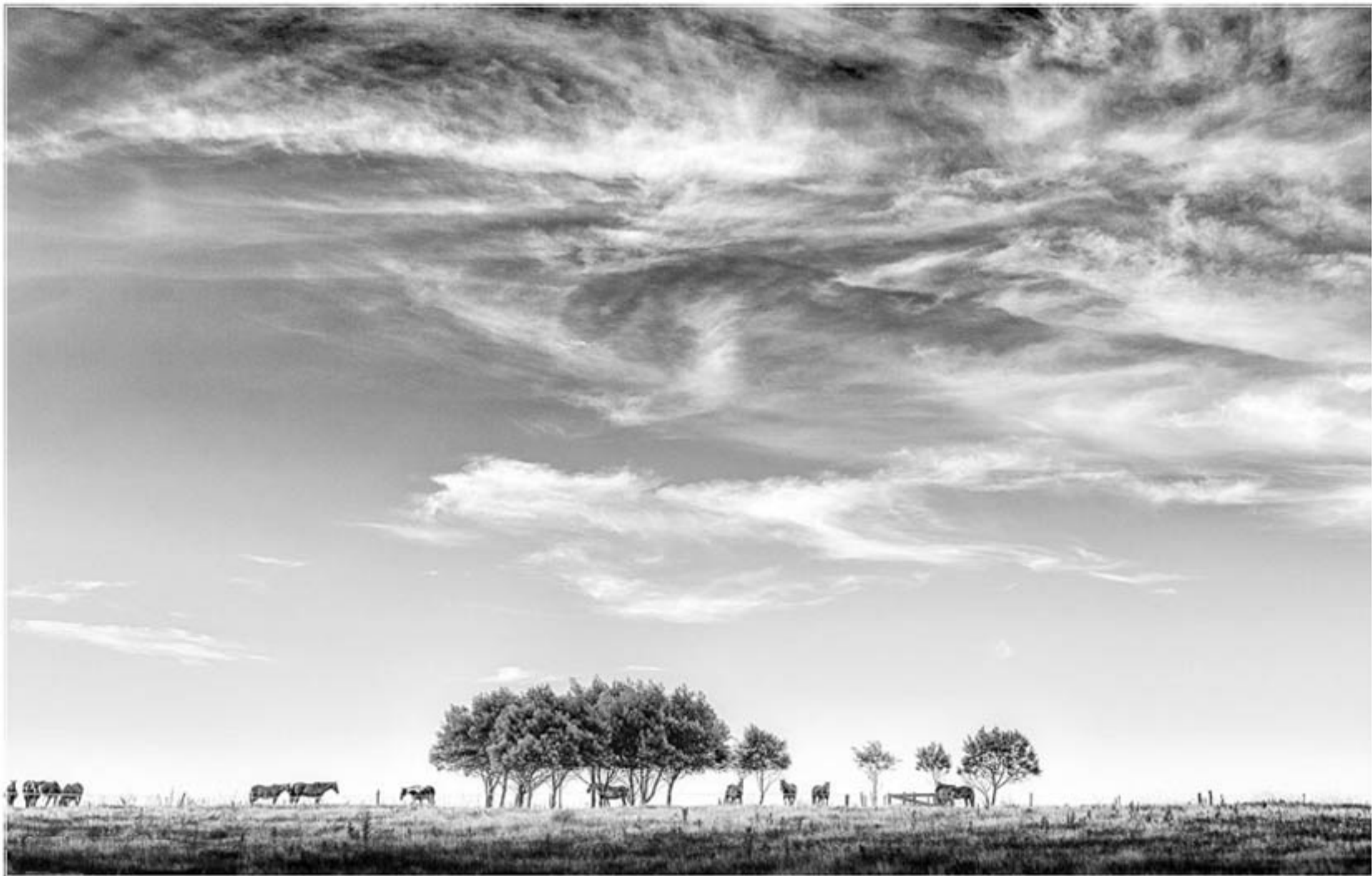
"LOS CABALLOS Y EL MONTE" TECNICA: Digital sin intervencion IMPRESIÓN: Gicée-papel de algodón