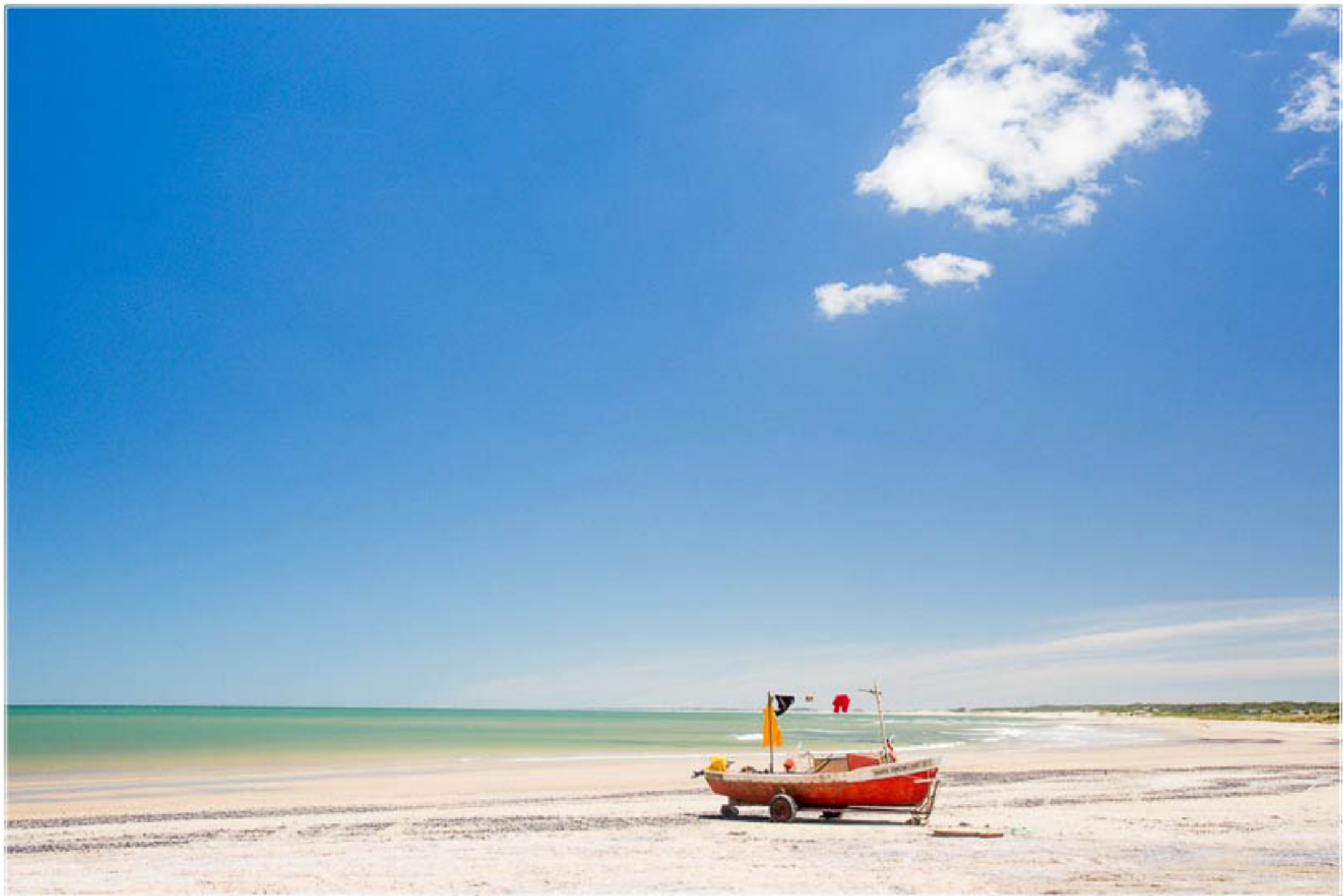
"VIAJAR LMIANO" TECNICA: Digital sin intervención IMPRESION: Glicée-Papel de algodón