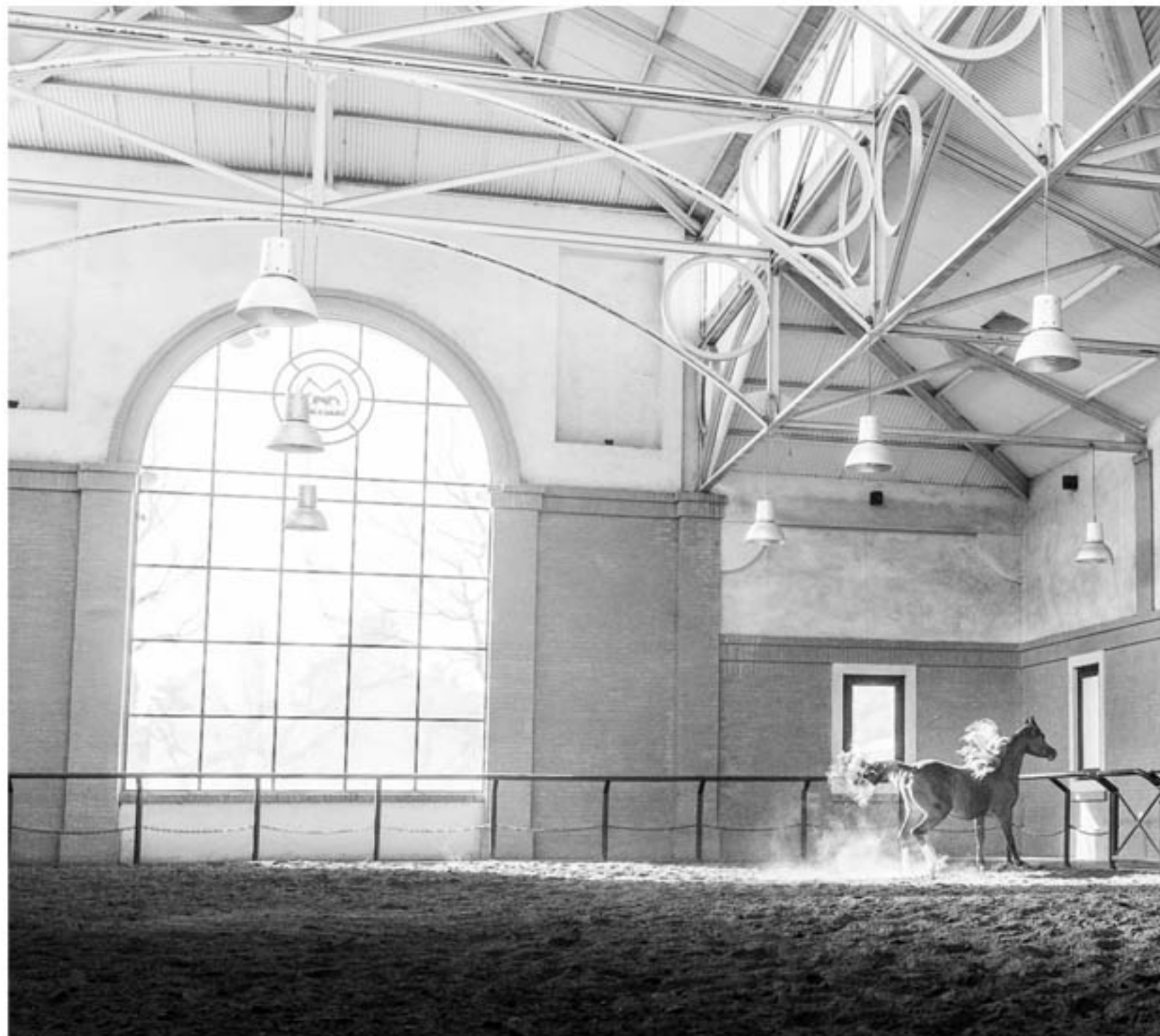
"LIBERAL" TECNICA: Digital sin intervención IMPRESION: Glicée-Papel de algodón