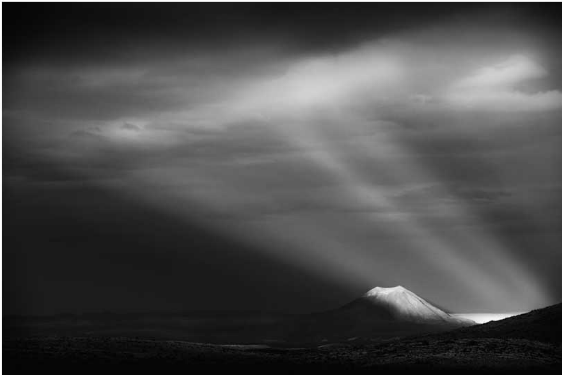
"INSTANTE DE GLORIA" TECNICA: Digital sin intervencion IMPRESIÓN: Glicée-papel de algodón