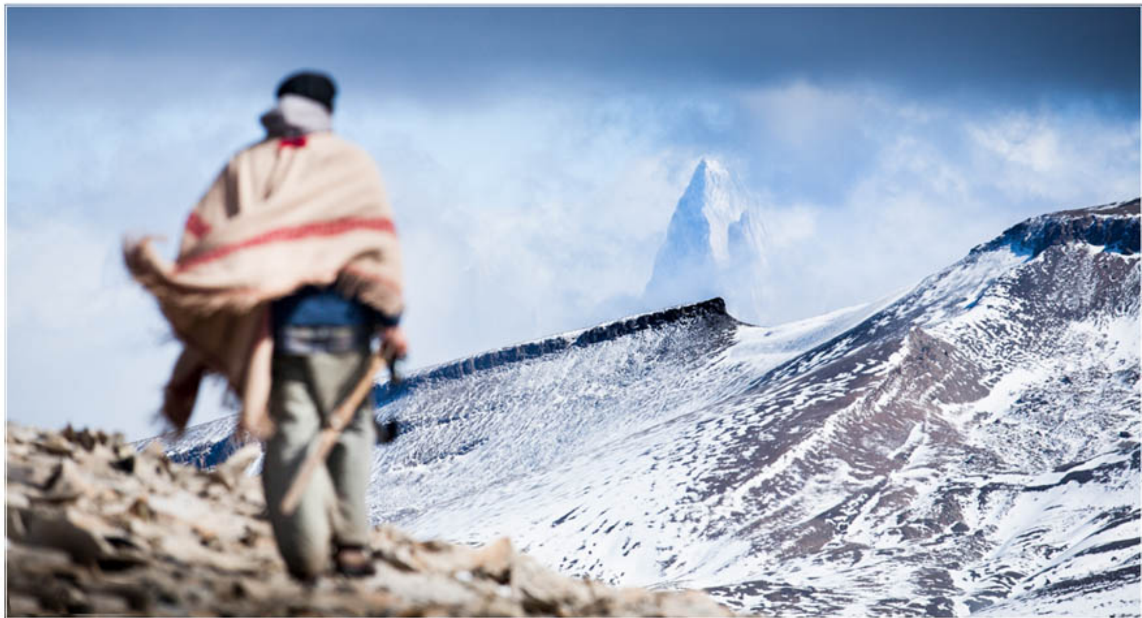
"MI MONTAÑA" TECNICA: Digital sin intervención IMPRESION: Glicée-Papel de algodón