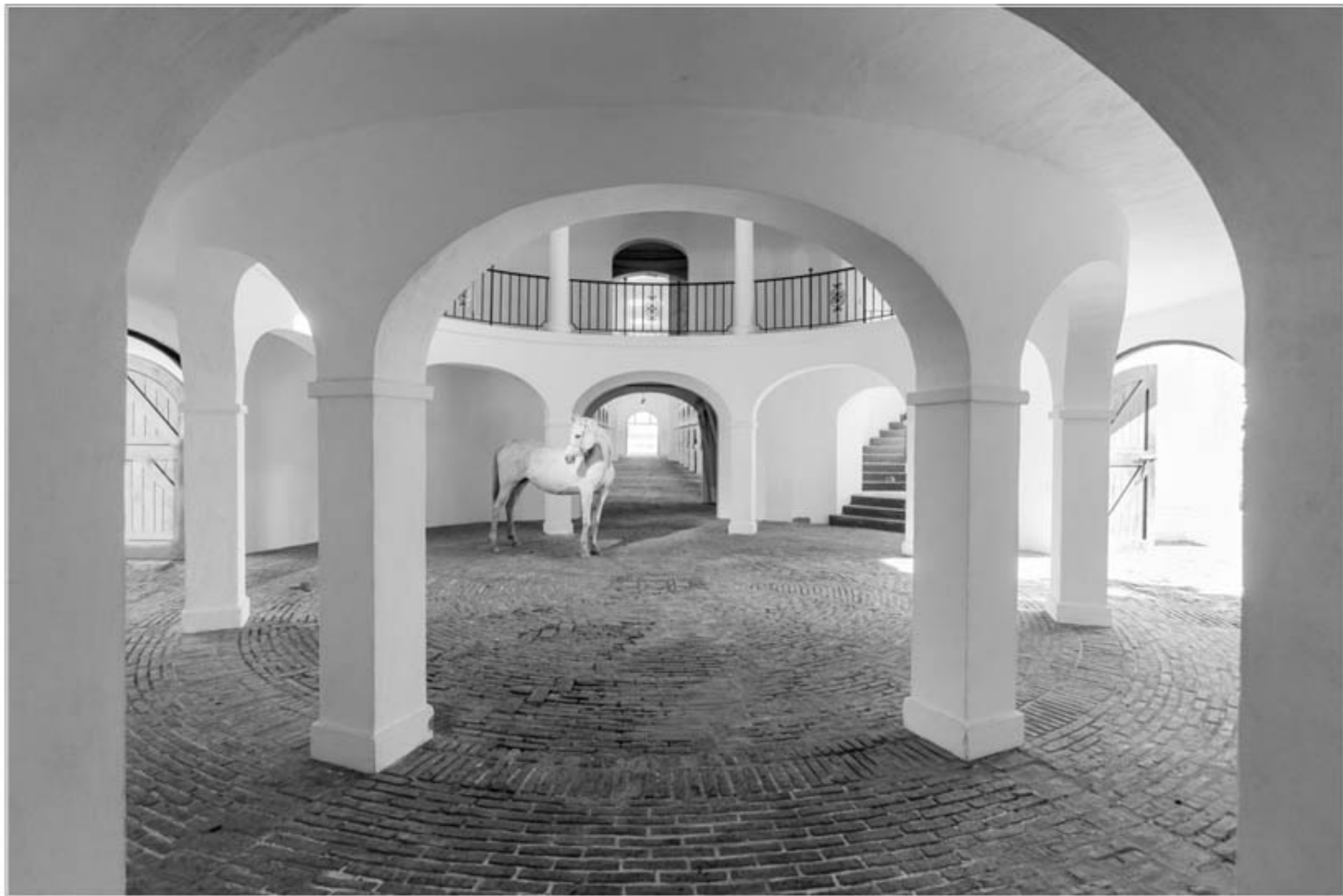
"BLANCO PURO" TECNICA: Digital sin intervención IMPRESION: Glicée-Papel de algodón