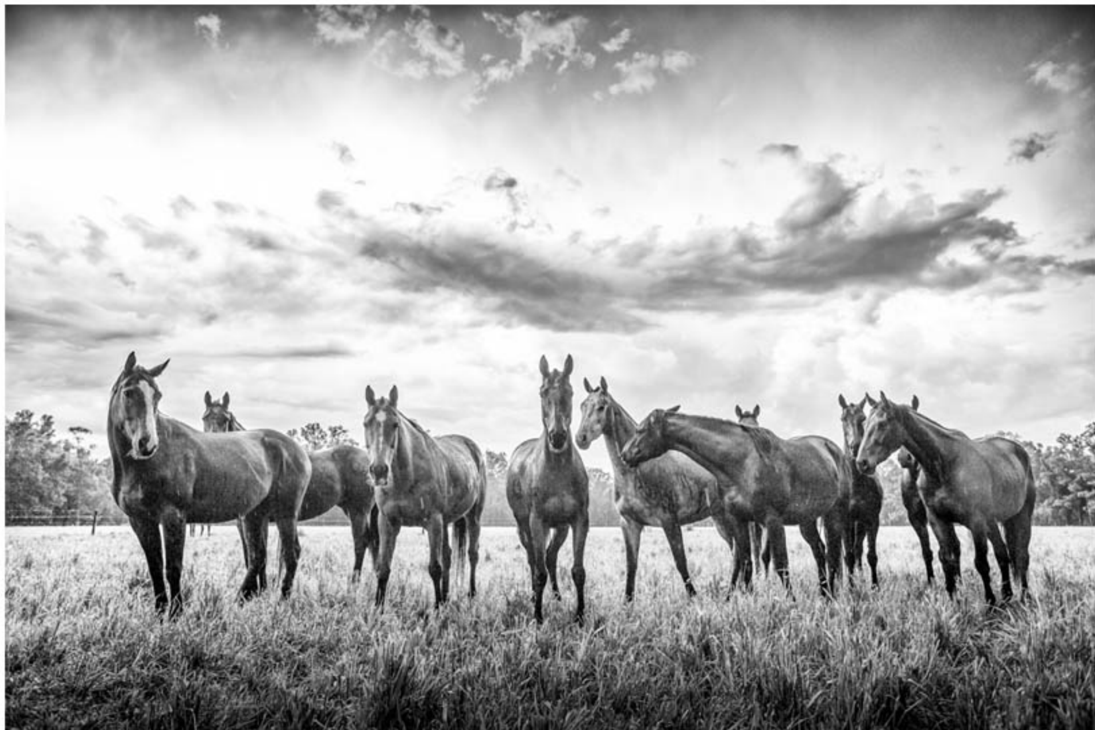
"ORGULLO DEL PAISANO II" TECNICA: Digital sin intervención IMPRESIÓN: Glicée-Papel de algodón