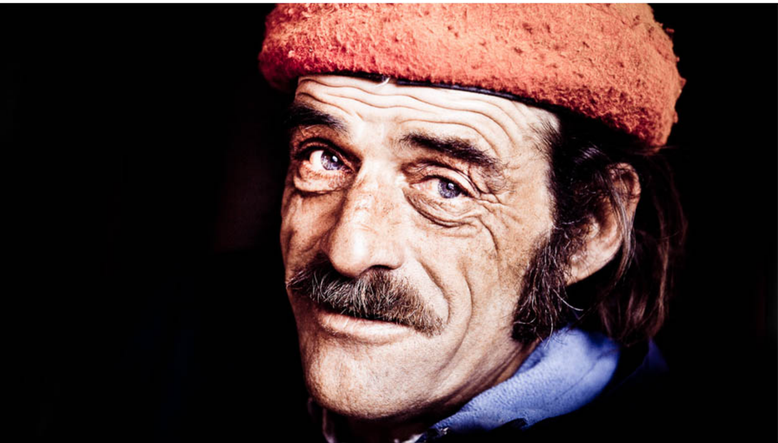
"EL GAUCHO GRINGO" TECNICA: Digital sin intervención IMPRESION: Glicée-Papel de algodón